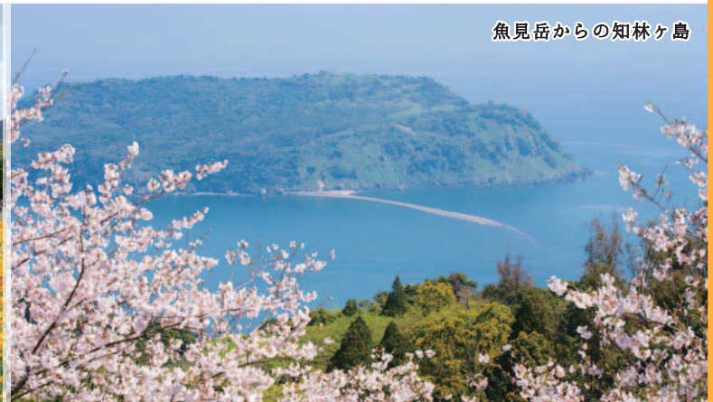
魚見岳からの知林ヶ島