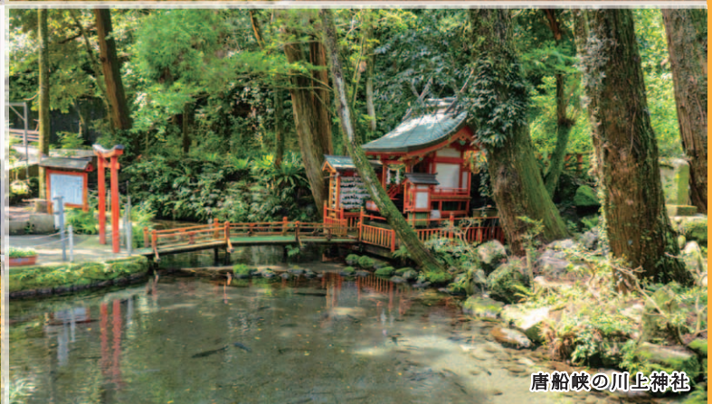
唐船峽の川上神社