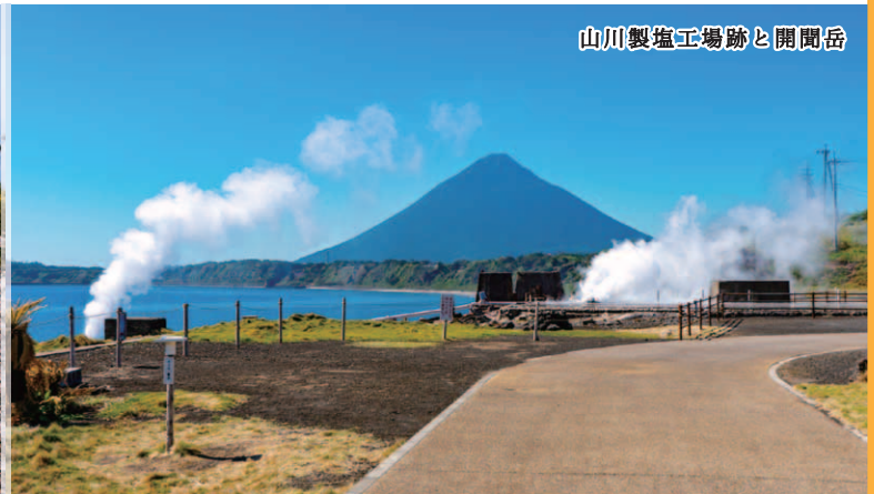
山川製塩工場跡と開聞岳