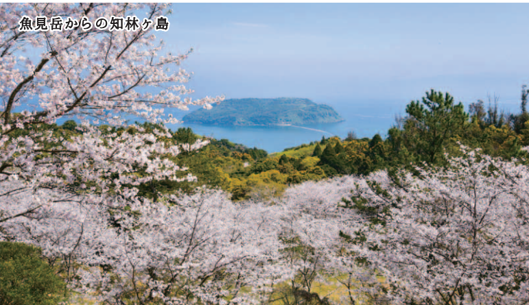
魚見岳からの知林ヶ島